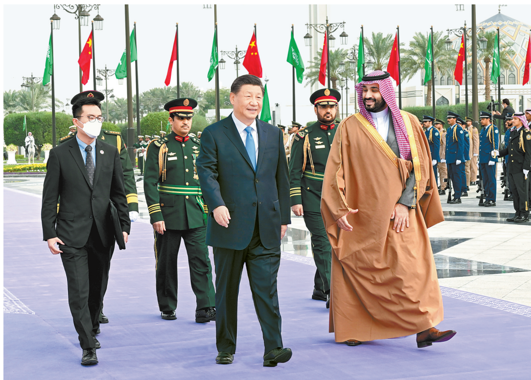
当地时间十二月八日中午，沙特王储兼首相穆罕默德代表国王萨勒曼，为正在沙特进行国事访问的国家主席习近平在利雅得王宫举行欢迎仪式。