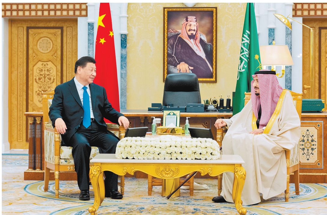
当地时间十二月八日下午，国家主席习近平在利雅得王宫会见沙特国王萨勒曼。