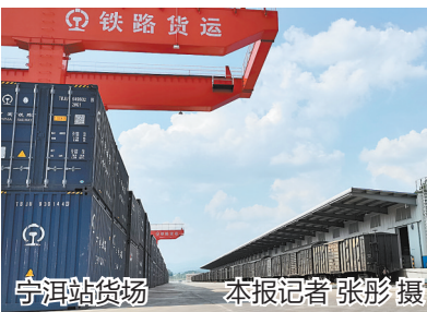
宁洱站货场

线产业开发、市场主体培育四大行动,加快推进中老铁路沿线开发,为普洱高质量发展注入新动能。围绕三年行动计划梳理建立市级中老铁路沿线开发项目库,截至目前,市级谋划储备项目共35个,项目总投资554.71亿元,已开工建设14个,其余项目正在有序推进。