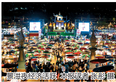
景洪夜经济活跃

年行动计划重点工作方案,建立中老铁路西双版纳段的沿线开发重大项目储备库,先期纳入三年行动计划的項目共52个,总投资1058亿元以上。截至10月底,已开工项目21个,完成投资28亿元。