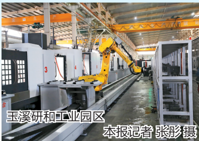
玉溪研和工业园区