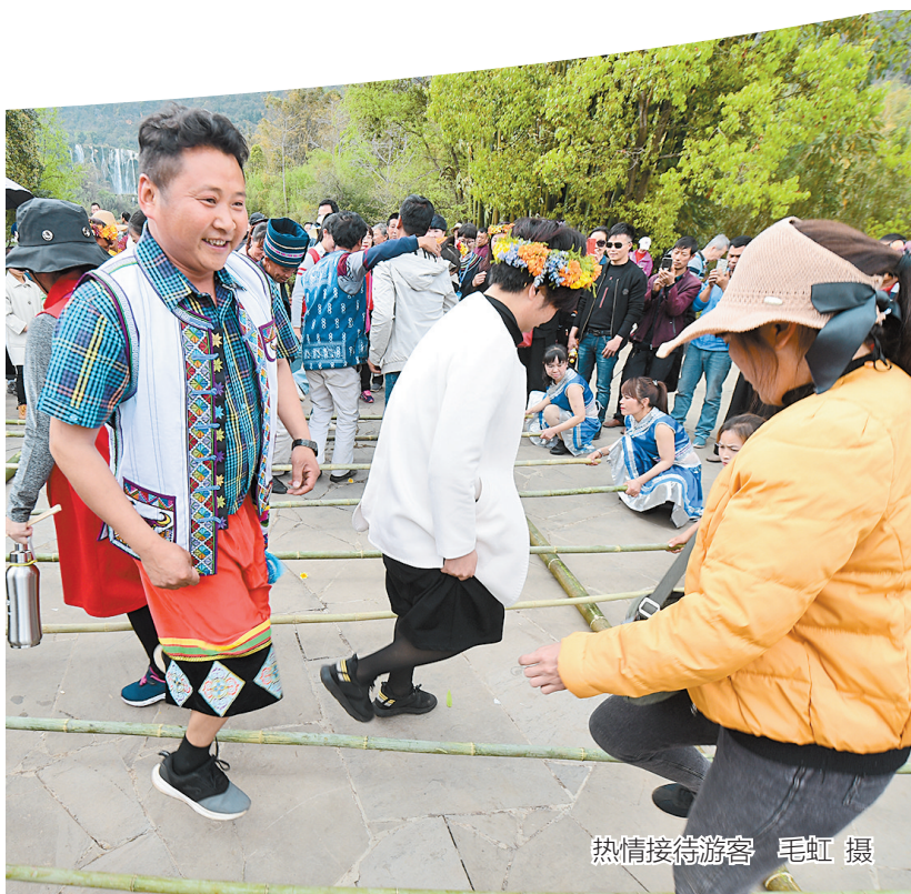
热情接待游客