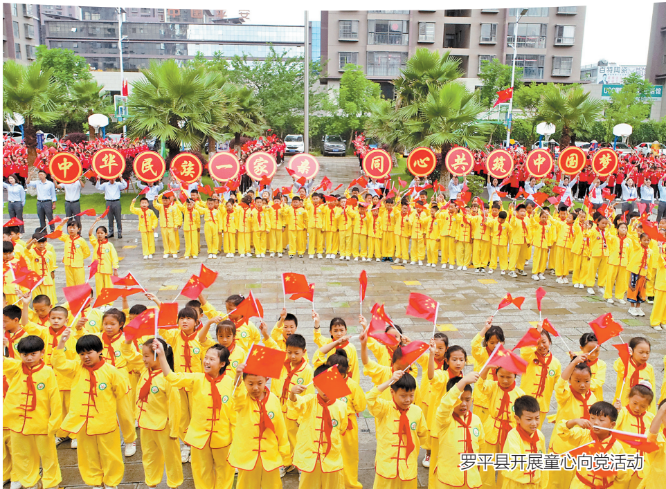
罗平县开展童心向党活动