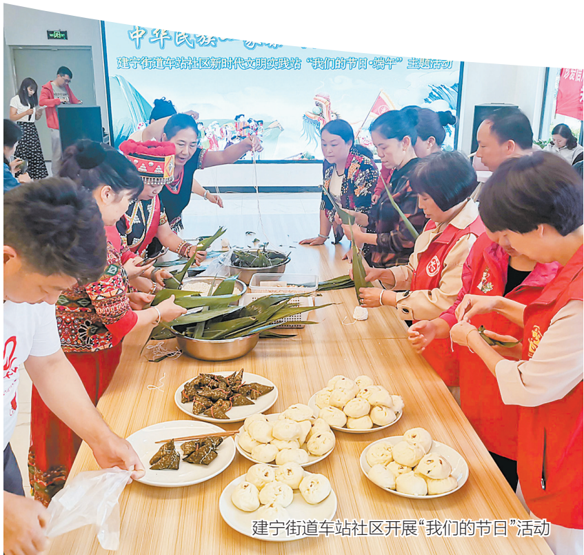
建宁街道车站社区开展“我们的节日”活动

党的二十大大吹响了全面建设社会主义现代化国家的号角，新时代、新征程，曲靖市将以习近平新时代中国特色社会主义思想为首要任务，牢牢把握“高质量发展是全面建设社会主义现代化国家的首要任务”这一历史使命，踔厉奋发、勇毅前行，着力深化内涵、丰富形式、创新方法，推动民族团结进步示范创建向铸牢中华民族共同体意识创建转型升级、提质增效，推动各民族像石榴籽一样紧紧抱在一起，共同建设伟大祖国、共同创造美好生活，为云南建设民族团结进步示范区作出曲靖贡献。