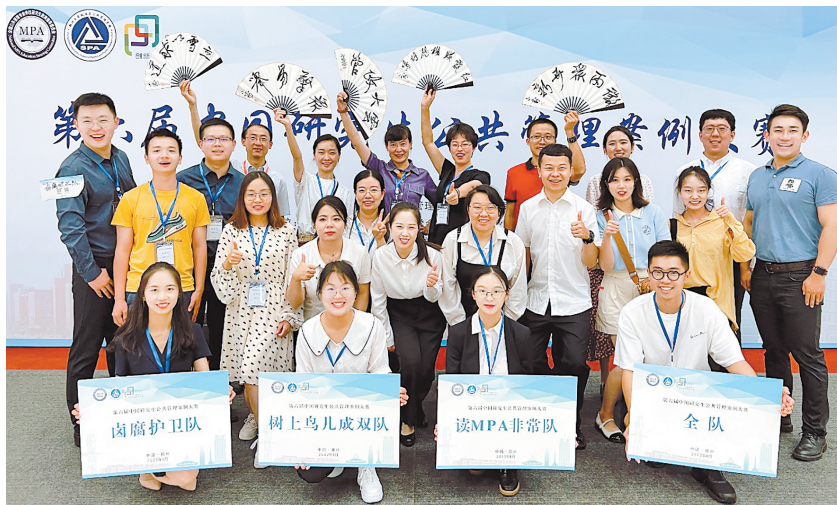
第六届中国研究生公共管理案例大赛云南大学斩获全国一等奖2项、二等奖2项、三等奖2项。

着力推进分类培养，深入实施研究生培养机制改革。确立学术学位以理论素养和创新能力培养为重点，专业学位