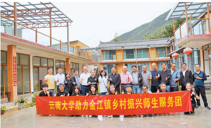
中国国际“互联网+”大学生创新创业大赛金奖“红岭金”项目乡村振兴服务团队

教书与育人相融合，以“理解中国”计划为抓手，构建大思政教育体系，在全省率先开设《习近平新时代中