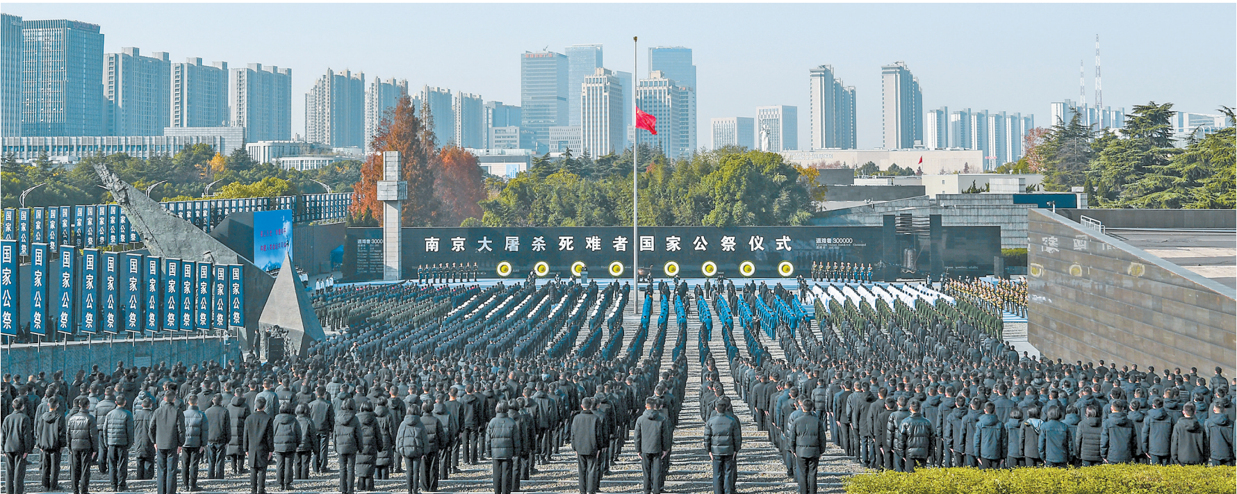
12月13日是第九个南京大屠杀死难者国家公祭日，南京大屠杀死难者国家公祭仪式在侵华日军南京大屠杀遇难同胞纪念馆举行。

参加过抗日战争的老战士老同志代表，中央党政军群有关部门和东部战区、江苏省、南京市负责同志，各民主党派中央、全国工商联负责人和无党派人士代表，南京大屠杀幸存者及遇难同胞亲属代表，国内相关主题纪念(博物)馆、有关高校和智库专家代表，宗教界代表，驻宁部队官兵代表，江苏省各界群众代表等参加公祭仪式。 2014年2月27日，十二届全国人大常委会第七次会议通过决定，以立法形式将12月13日设立为南京大屠杀死难者国家公祭日。