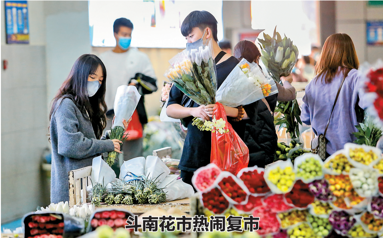
斗南花市热闹复市

昆明斗南被誉为“亚洲花都”,鲜花远销50多个国家和地区。花市于12月初全面恢复普通市场交易和大宗交易,并根据夜间交易及人流量特点,发展花卉消费体验、旅游体验、文化体验,沉寂了许久的花市再次变得热闹起来。