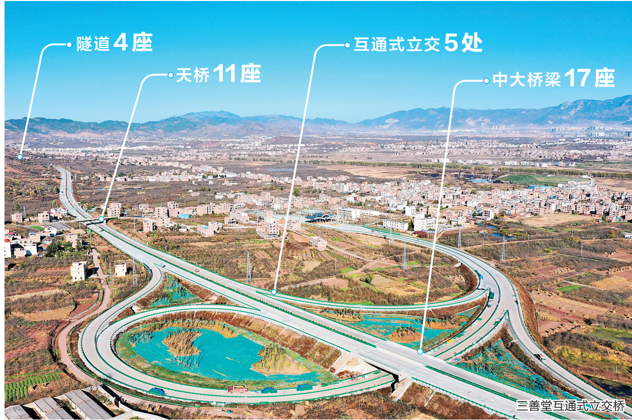
三善堂互通式立交桥

乌蒙飞歌，大地吟唱。畅行在西环高速上，满心欢喜的万千群众正以更加开放的胸怀，经营和创造着未来。随着这条绕城大动脉的畅通，大山大水、大美昭阳，大道通衢向未来。