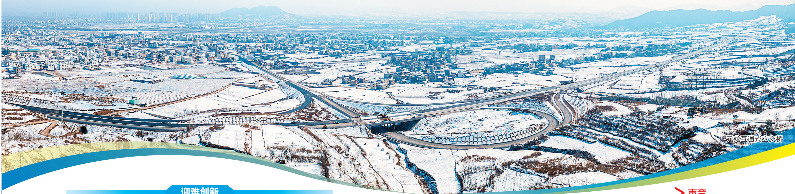
元龙互通式立交桥

宜昭高速公路一同构成昭通中心城市绕城大动脉。至此，昭通市也将成为我省第四个中心城区建成绕城高速公路的州市。这也标志着昭通“两环四纵五横九联”高速公路网从蓝图到现实又迈进了一步，连通内外的综合交通运输体系逐渐形成，必将成为昭通经济腾飞的“黄金大道”。