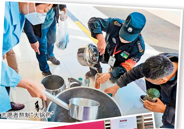
志愿者熬制“大锅汤”