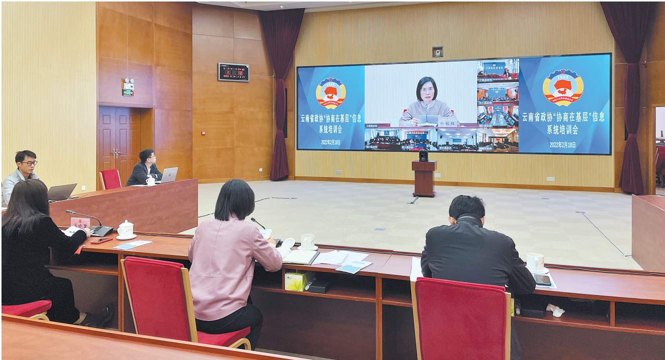
云南省政协系统“协商在基层”信息系统培训会

十二届省政协以来,按照中共云南省委部署,省政协紧跟时代潮流,抢抓时代机遇,主动把打造“数字政协”平台融入“数字云南”建设,坚持全省政协系统“一盘棋”规划、三级政协联动实施,着力打造省级统建、多级共用、协同联动、横向融合、纵向贯通、多端协同的全省政协信息化生态圈,形成全时空、全业务、全覆盖,互联互通、数据共享、业务协同的信息化体系,大大提升了政协履职的广度、深度和效度,切实以数字化赋能政协各项履职活动,开启了云南政协信息化履职新时代。