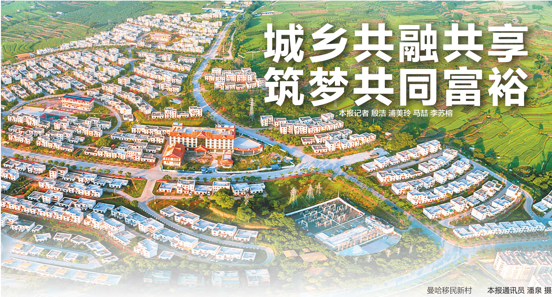
本报记者 殷洁 浦美玲 马喆 李苏榕