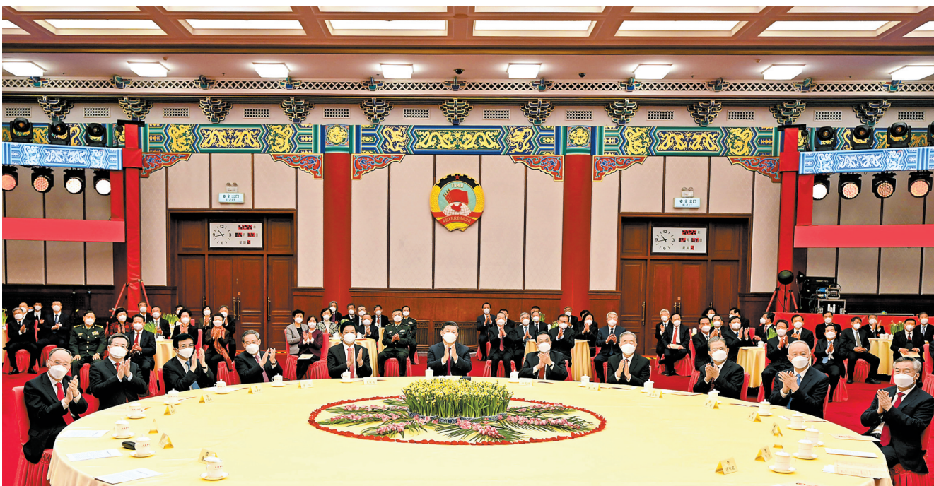
12月30日，全国政协在北京举行新年茶话会。党和国家领导人习近平、李克强、栗战书、汪洋、李强、赵乐际、王沪宁、蔡奇、丁薛祥、李希、王岐山出席茶话会并观看演出。

新华社北京12月30日电 中国人民政治协商会议全国委员会12月30日上午在全国政协礼堂举行新年茶话会。党和国家领导人习近平、李克强、栗战书、汪洋、李强、赵乐际、王沪宁、蔡奇、丁薛祥、李希、王岐山等同各民主党派中央、全国工商联负责人和无党派人士代表、中央和国家机关有关方面负责人以及首都各界各人士代表欢聚一堂，共迎2023年元旦。