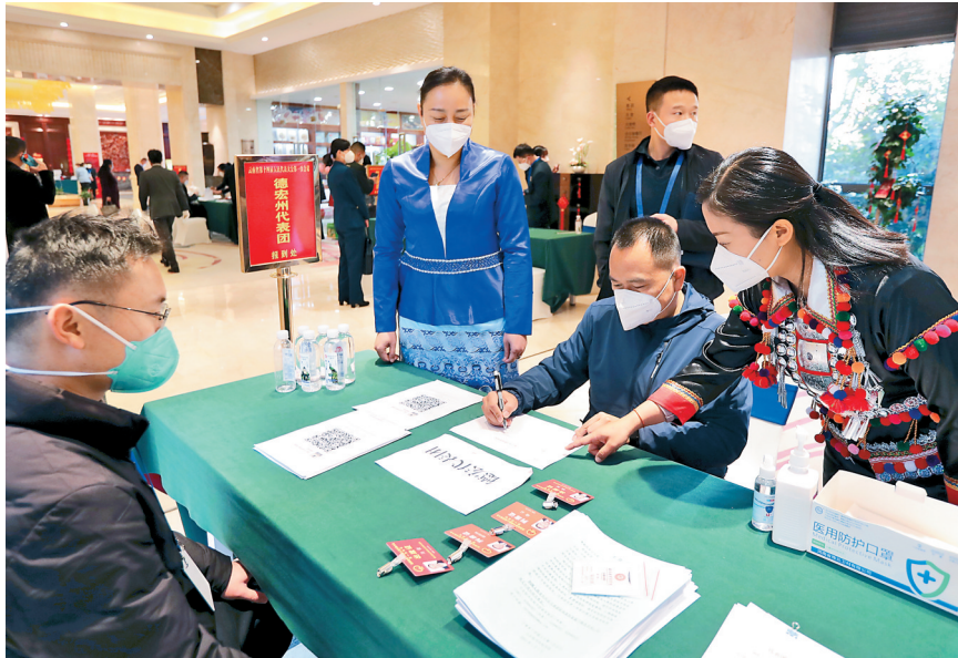
1月9日,出席省十四届人大一次会议的代表陆续抵昆报到。