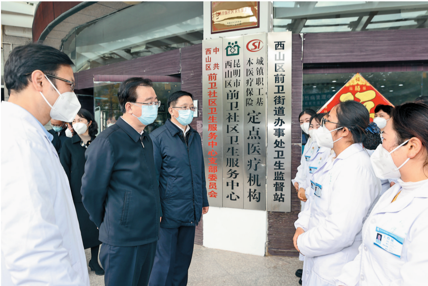
1月20日上午,省委书记王宁、省长王予波一行来到昆明市西山区前卫社区卫生服务中心,看望基层医务工作者。

环卫工人常年奋战在大街小巷。在盘龙区金菊路环卫工人驿站,王宁、王予波看望慰问环卫工人,关切询问大家的工作生活情况,感谢大家为城市的干净、整洁、美丽付出的辛苦劳动,要求有关部门加强保障,在全社会营造关心关爱环卫工人的氛围。 春节临近,昆明市儿童福利院里洋溢着节日的欢乐气氛。王宁、王予波走进孩子们中间,欣赏他们的绘画作品,与他们一起剪窗花,给孩子们送上大礼包。王宁指出,做好困境儿童等困难群体保障关爱工作,是社会文明进步的体现。他要求有关部门加大支持力度,提升福利院服务水平,为困境儿童成长、成才营造良好环境,让他们感受到社会主义大家庭