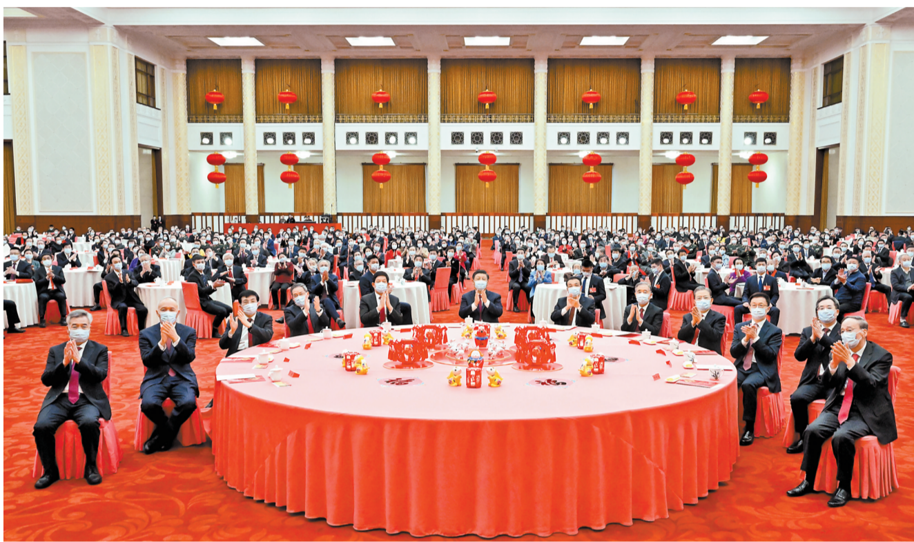
1月20日,中共中央、国务院在北京人民大会堂举行2023年春节团拜会。党和国家领导人习近平、李克强、栗战书、汪洋、李强、赵乐际、王沪宁、韩正、蔡奇、丁薛祥、李希、王岐山等同首都各界人士齐聚一堂、共迎新春。

新华社北京1月20日电 中共中央、国务院20日上午在人民大会堂举行2023年春节团拜会。中共中央总书记、国家主席、中央军委主席习近平发表讲话,代表党中央和国务院,向全国各族人民,向香港特别行政区同胞、澳门特别行政区同胞、台湾同胞和海外侨胞拜年。 习近平强调,即将过去的壬寅虎年,是党和国家发展史上极为重要的一年。面对风高浪急的国际环境和艰巨繁重的国内改革发展稳定任务,全党全军全国各族人民迎难而上、团结奋斗,凭着龙腾虎跃的干劲、敢入虎穴的闯劲、坚忍不拔的韧劲,书写了社会主义现代化建设的新篇章。 李克强主持团拜会,栗战书、汪洋、