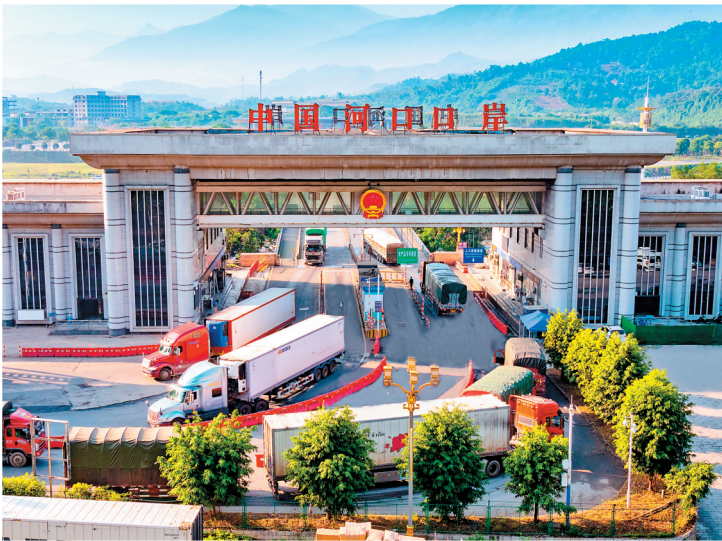
繁忙的河口北山口岸