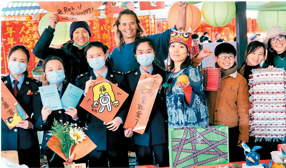
外国友人积极参与大理税务宣传

球业务发展方面积累的先进经验、多元产品和 先进理念带到云南,共享发展机遇,共创美好 未来。