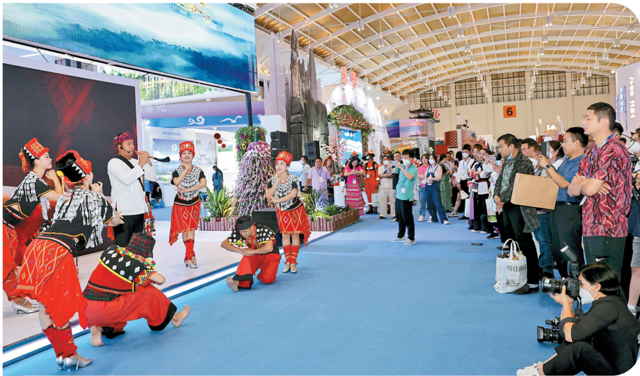
旅交会文艺展演吸引观众