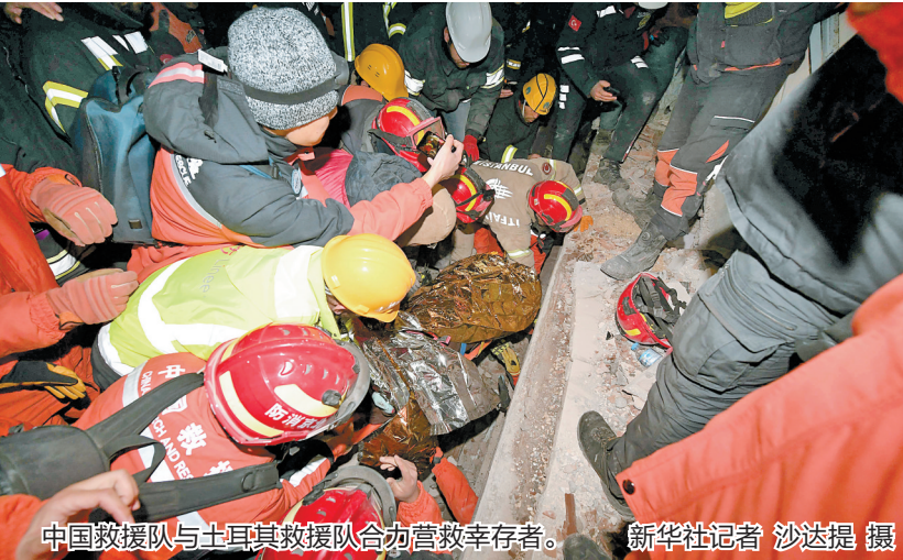
中国救援队与土耳其救援队合力营救幸存者。

到访中国救援队营地，对中国救援队开展的工作表示感谢。上海电力、中化天辰、三一重工集团、国家电投上海能科等中资企业在土耳其分支机构为救援队送来油料、重型设备、饮水、食材等物