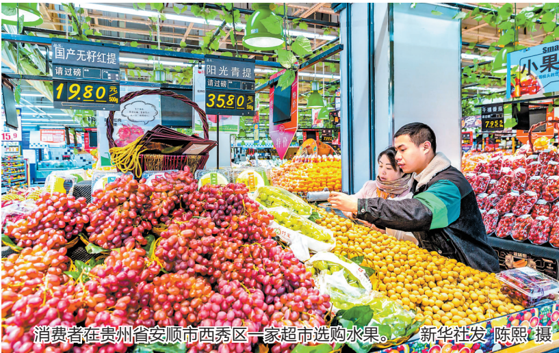
消费者在贵州省安顺市西秀区一家超市选购水果。

新华社北京2月10日电（记者 魏玉坤 魏弘毅）国家统计局10日发布数据，1月份，全国居民消费价格指数（CPI）同比上涨2.1%，涨幅比上月扩大0.3个百分点；环比由上月持平转为上涨0.8%。