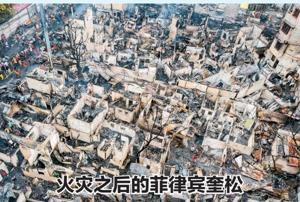
火灾之后的菲律宾奎松

近年来，甘肃省武威市凉州区抢抓以沙漠、戈壁、荒漠地区为重点的大型风光伏基地建设机遇，探索光伏治沙新模式，利用腾格里沙漠未利用国有土地50万亩，规划建设九墩滩光伏治沙示范园区，总装机容量1500万千瓦。