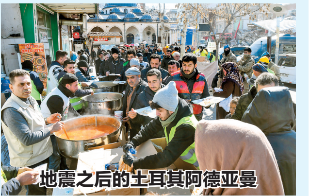
地震之后的土耳其阿德亚曼

根据最新统计数据，土耳其地震灾区有超过8.4万栋建筑倒塌，严重受损或急需拆除。图为2月18日，人们在土耳其南部阿德亚曼省阿德亚曼市领取食物。