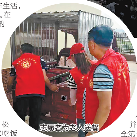
志愿者为老人送餐

符合食堂要求的食材一律退回。同时,每日新到食材要进行48小时留样检测,并设立了食品安全第一负责人和食品安全管理员,对食堂食品安全进行全面监管。