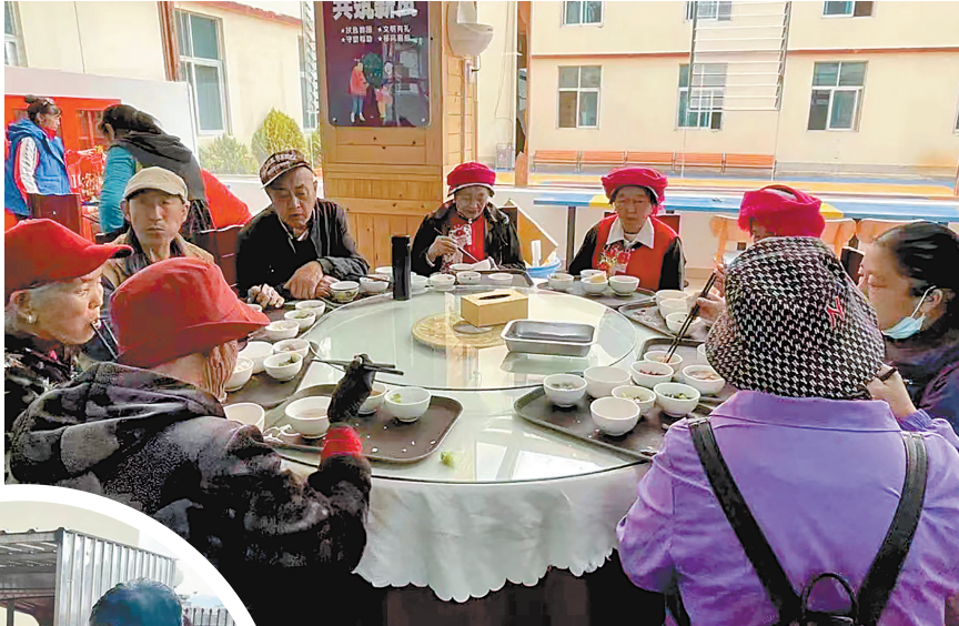
迪庆州和济惠民老年幸福食堂

“对老年人来说,食品安全一定要放在首位。”迪庆藏族自治州养老综合服务中心城区服务站和济惠民“老年幸福食堂”相关负责人介绍,为保证食品安全,食堂通过市场调研选定了质量与信誉过硬的食材供应商,并由专人负责接收食材,对食材质量严格把关,对不