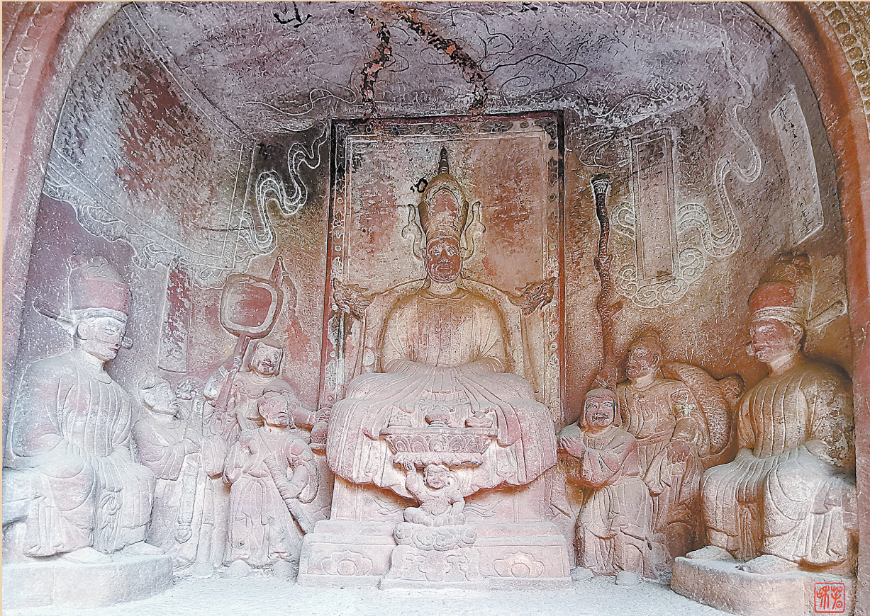
剑川石宝山石窟南诏王异牟寻坐朝造像，左边持杖披笠者即为清平官郑回

郑回，一名来自中原腹地的大唐县令，被南诏俘虏后成为王室老师，传播着中原文化。后郑回担任清平官，改革南诏社会制度，促成南诏与唐朝重归于好，推动云南走向开放繁荣。