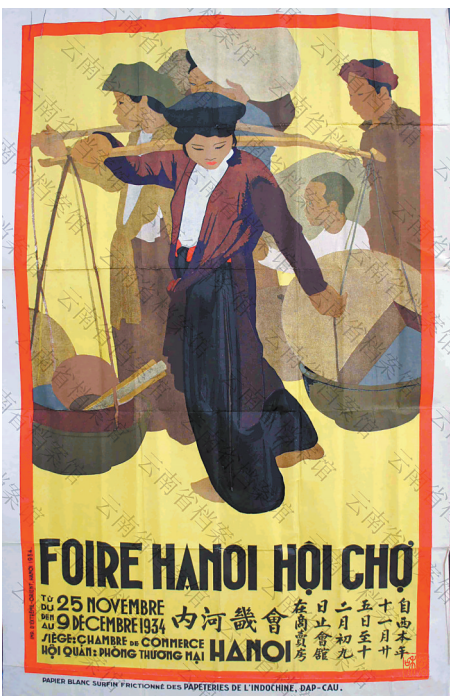
河内第十三次商品展览会广告

云南与周边国家各地区的边境贸易有着悠久的历史传统，在新时代云南加快发展口岸经济的关键时期，了解云南边境贸易的相关历史，汲取前人智慧，对云南推进高水平开放，实现跨越式发展有着积极作用。