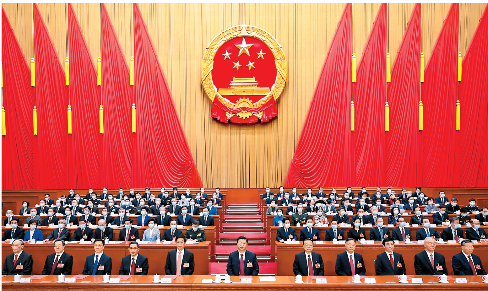
3月13日,第十四届全国人民代表大会第一次会议在北京人民大会堂闭幕。习近平等党和国家领导人在主席台就座。