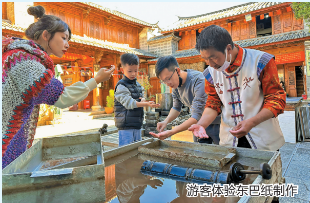
游客体验东巴纸制作

听流水潺潺,了解古城历史、品读丽江文化,云南之美不止于山水田园,更体现在民族文化之中。