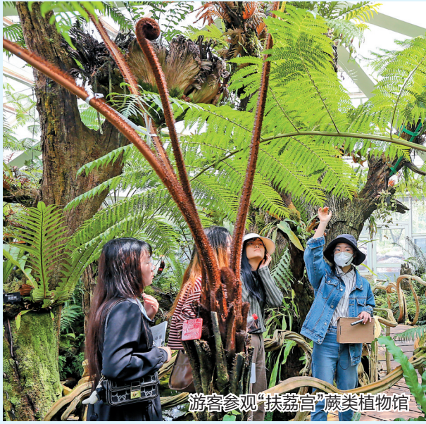
游客参观“扶荔宫”蕨类植物馆