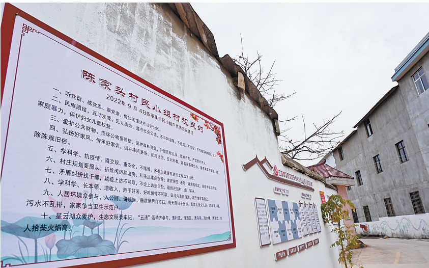
移风易俗纳入村规民约