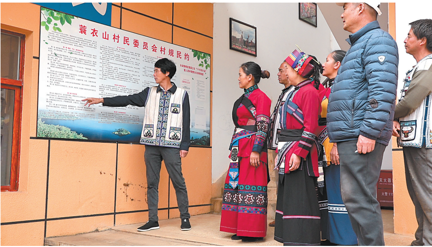
倡导村民移风易俗