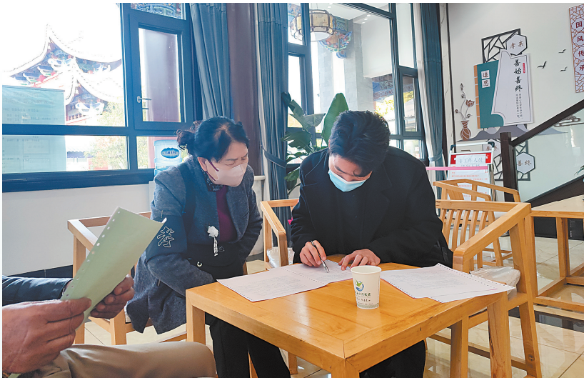
殡仪馆一对一引导服务