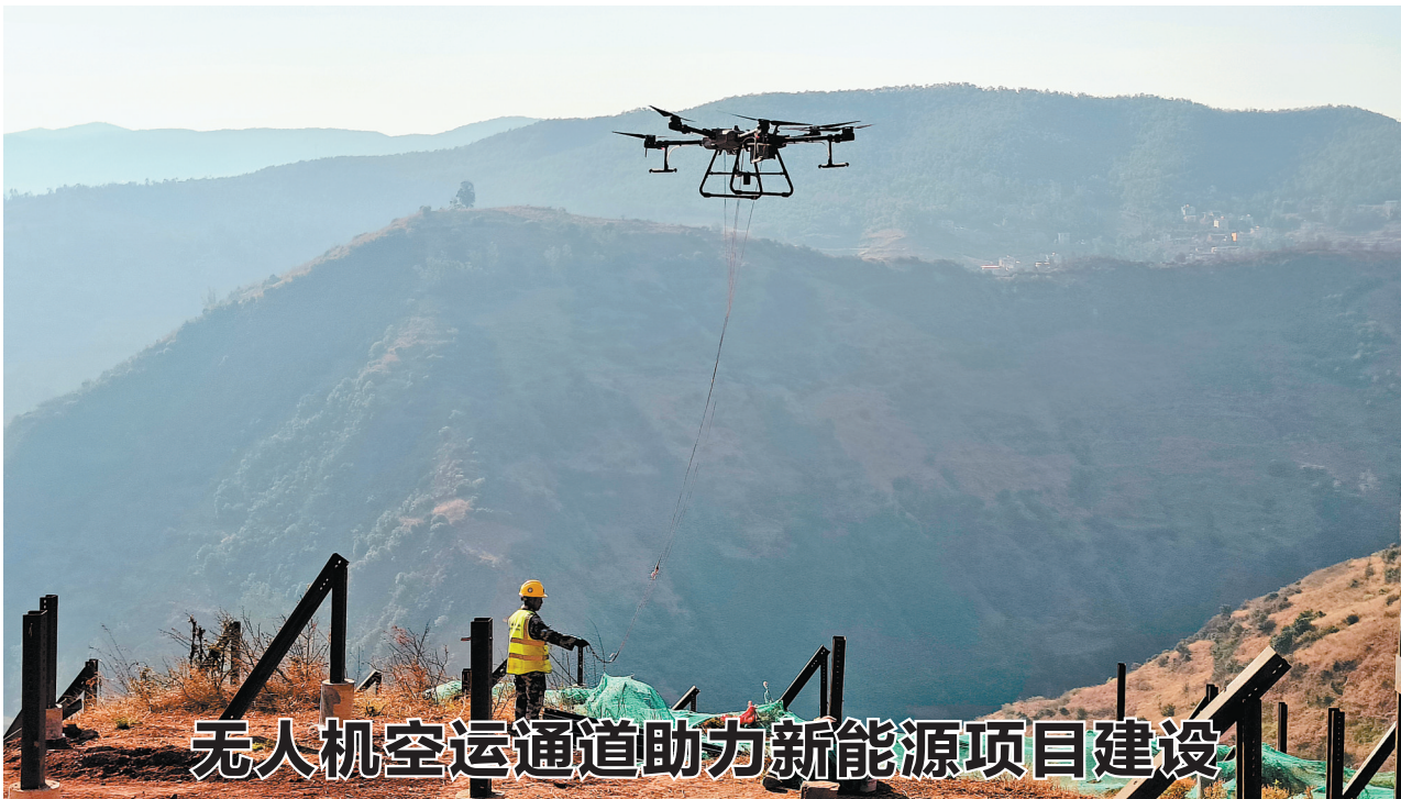
无人机空运通道助力新能源项目建设

今年以来,华电集团云南区域开辟出光伏组件无人机空中运输通道,加速光伏等新能源建设。华电云南区域近年开工建设了42个风光电新能源项目,项目多位于地形地势复杂的陡坡山地,无人机吊运光伏组件一天的完成量相当于12名人工的工作量,大幅节约了时间和人力成本。