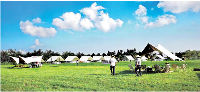
废弃矿山修复后引进的露营项目

三四月间的昆明市西山区团结街道双山垭口，云海之间，草长莺飞，3万余株进入花期的苹果树招蜂引蝶，半山腰点缀着一顶顶帐篷，吸引了越来越多的昆明人前往郊游、露营。 很多人并不知道，五六年前，这里还是一片“秃头”山，因矿区过度开采而留下累累“伤痕”。 “我们刚来的时候，这儿还是个寸草不生的荒山头。”团结鑫苹果庄园相关负责人介绍。虽然从昆明主城区出发，40分钟的车程即可抵达双山垭口，但与主城区“春城无处不飞花”的旖旎诗意不同，这里以前是大片大片被废弃的“秃头”矿山。 “秃头”并非天生，西山区矿产资源丰富，其中磷矿、石英砂等储量丰富，矿位集中、品位高、开采方便。20世纪中后期，因经济发展需要，辖区采矿业发展迅速，采矿带来经济效益的同时，也对矿区植被造成了严重破坏。而位于西山区团结街道的双山垭口，就是其中的典型。这里的矿区山体常年裸露、沟壑满目、寸草不生，滑坡、山洪等地质灾害和塌陷事故时有发生，对周边人民群众生产生活带来严重威胁。 为做好生态保护，2017年，西山区完成市区下达任务，关停滇池流域及西山重点保护区18个矿山，后续自加压力，于2018年、2020年分批次关停辖区其他区域24个矿山。 关停只是第一步。2017年，西山区确定了“矿山复绿+现代苹果示范园”生态修复模式，积极引导扶持企业参与双山垭口矿山治理修复和特色农业发展。依托“团结苹果”产业优势，将治理后适宜农业种植的土地用来发展特色产业，推动现代苹果采摘休闲示范园建设。 为充分调动社会资本的积极性，利用原有荒山、矿业用地、林地等发展替代产业，更好地推动矿区的修复和保护，西山区按照50年的承包期，将717亩集体林地承包经营权，统一流转给辖区内的龙头民营企业，鼓励发展生态产业，打造多功能综合产业生态示范园。 在这期间，为固定山体，防治地质灾害，西山区采取生态农业方式对矿区开展生态修复，选择适合当地自然条件的新优苹果品种，进行260亩规范化栽培种植。 海拔2195米之上的团结街道，因日照充足、昼夜温差大，是云南著名的苹果产地。多年以来，产自这里的苹果，以甜蜜的糖心征服“吃货”的心。然而，要把苹果树种在采矿废弃的“秃头”山上，挑战多多。 “我们用了整整一年的时间进行土地平整，又用了4年时间进行种植改