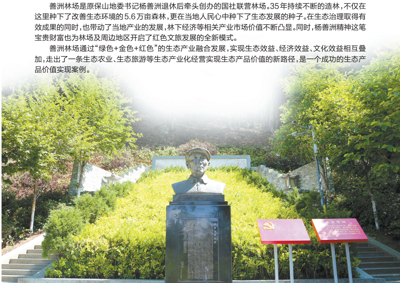
善洲林场的杨善洲塑像

绿色是善洲林场的底色。 善洲林场场长王金波是1988年与老书记杨善洲一同植树造林的林场老职工，目睹了林场所在地——大亮山如何从荒山到恢复生态造福百姓的全过程。他介绍，二十世纪六七十年代，大规模的毁林开荒使得原本翠绿的大亮山生态遭到极大破坏。杨善洲同志退休后回到家乡牵头创办国社联营林场，带领林场职工和周边群众艰苦奋斗，植树造林5.6万亩。2009年杨善洲将大亮山林场经营管理权无偿移交给国家。当时对林场种植树木的价值进行了估算，超过3亿元。 施甸县林草局负责人介绍，承接善洲林场管理任务后，施甸县林草、自然资源、农业等部门的持续投入精细养护，使善洲林场“绿色家底”越来越夯实丰厚。特别是近年来，在习近平生态文明思想