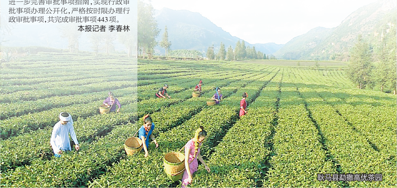
耿马县勐撒高优茶园