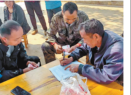
务工村民领取工资

坚定不移贯彻落实“绿水青山就是金山银山”理念，念好“山字经”，唱好“林果戏”，以尖山坡种植基地“一枝独秀”推动全村产业“百花齐放”，从“一条腿”走路到“多条腿”快跑，以“阳光产业”蹚出“幸福事业”。