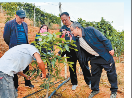
芒果种植技术培训