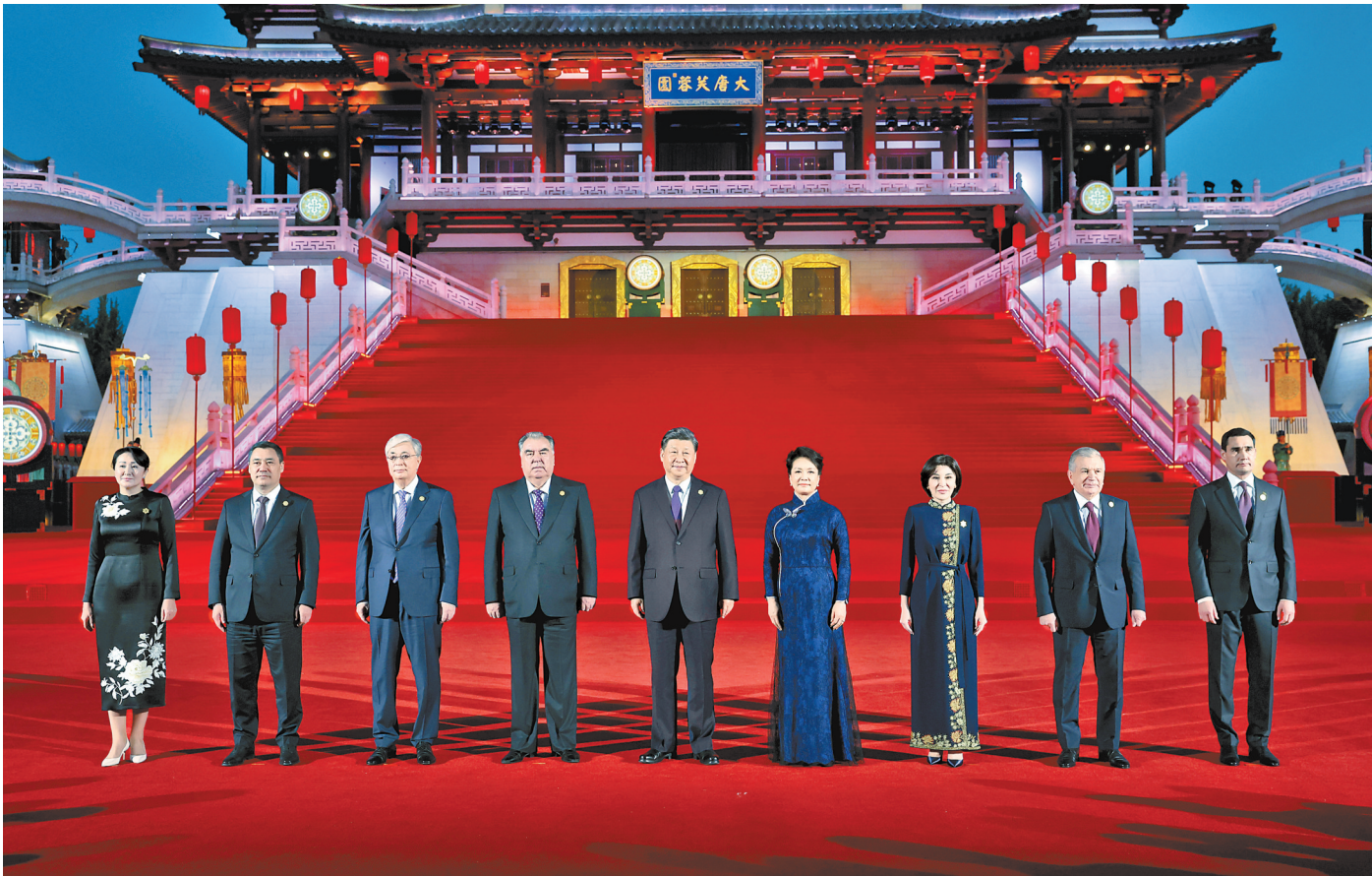
5月18日晚，国家主席习近平和夫人彭丽媛在陕西省西安市大唐芙蓉园为出席中国—中亚峰会的中亚国家元首夫妇举行欢迎仪式和欢迎宴会。宴会后，习近平夫妇同贵宾们共同观看中国同中亚国家人民文化艺术年暨中国—中亚青年艺术节开幕式演出。这是习近平夫妇在紫云楼前同贵宾合影留念。