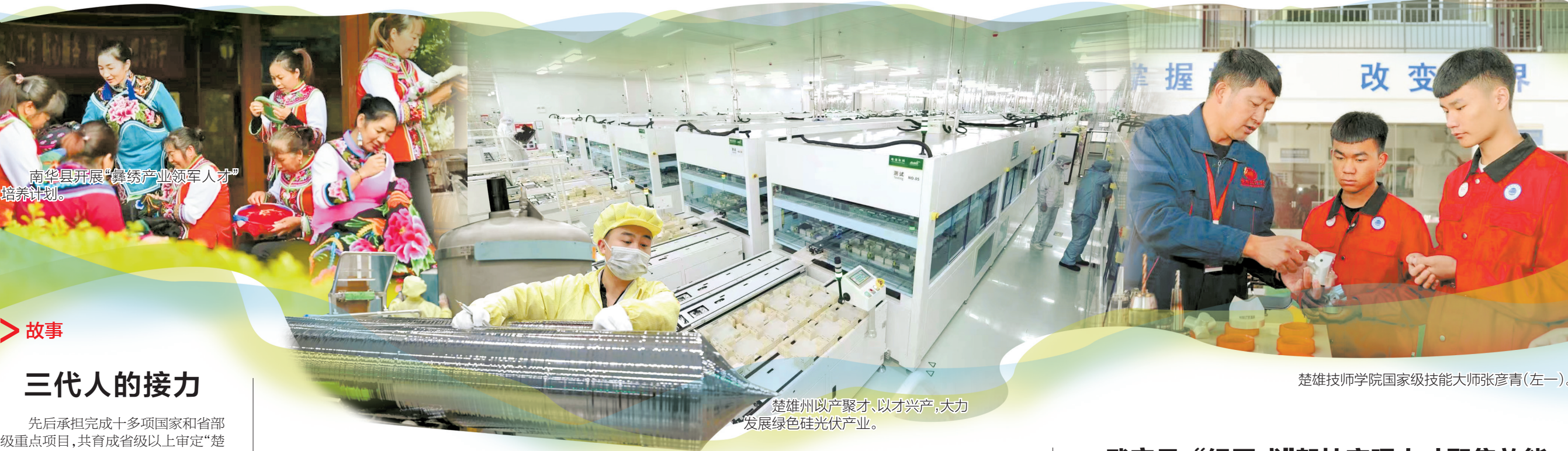
南华县开展“彝绣产业领军人才培养计划”。

地”(以下简称“一中心、一高地、一宝地”)的战略目标，制定了一系列加强和改进新时代楚雄人才工作的政策措施，加快推进新时代人才强州“五项工程”和“智汇楚雄”行动，最大力度支持和鼓励人才创新创业，全州人才队伍建设持续加强，推动了全州经济社会各项事业高质量发展。