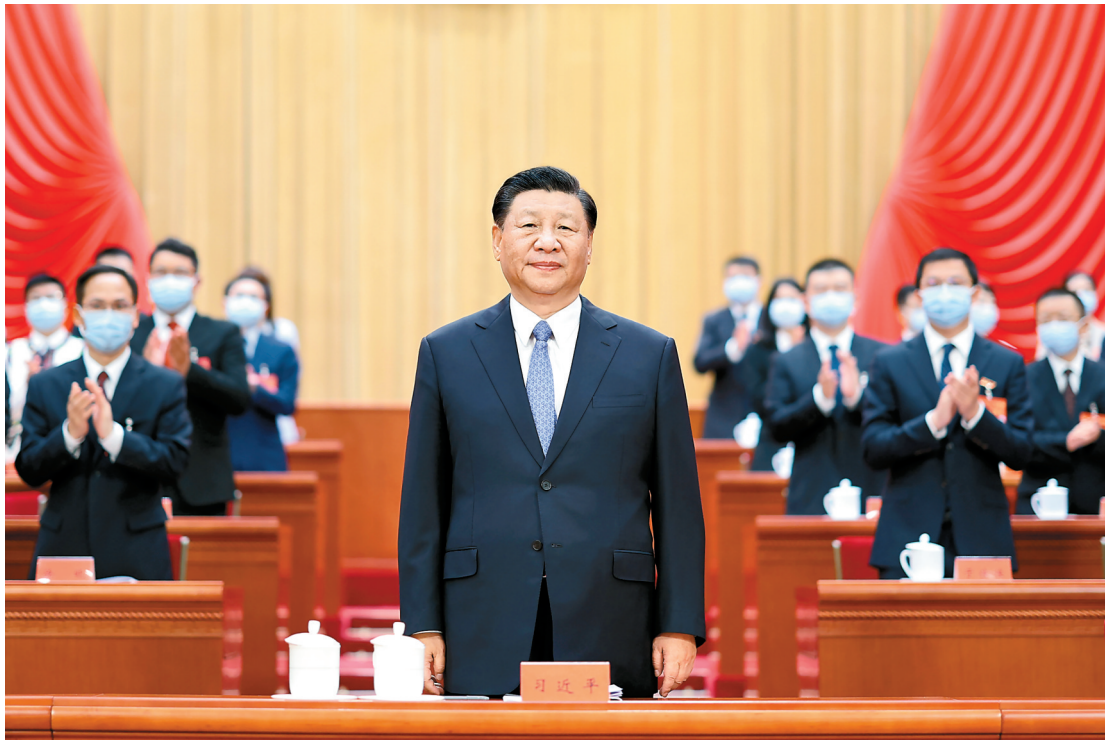
6月19日,中国共产党第十九次全国代表大会在北京人民大会堂开幕。这是中共中央总书记、国家主席、中央军委主席习近平在主席台向与会代表致意。

新华社北京6月19日电 中国共产党第十九次全国代表大会19日上午在人民大会堂开幕。习近平、赵乐际、王沪宁、丁薛祥、李希等党和国家领导人到会祝贺,蔡奇代表党中央致词。