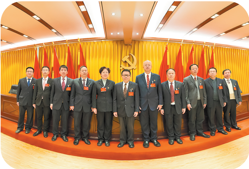
学校新一届党委班子成员

学校主动服务和融入国家“一带一路”建设,打造了“留学云南+技能培训”高职品牌。实施中德SGAVE汽车机电人才培养项目;与爱尔兰斯莱戈理工学院合作举办机电一体化技术专业中外合作项目;中老机电人才培养项目被评为“中国—东盟高职院校特色合作项目”;与老挝苏发努冯大学及其孔子学院共建了老北首个“中文+职业技能”培训基地;与菲律宾宾·博斯科大学、马来西亚国际文化交流中心签署三方合作意向;培养来自老挝、越南、缅甸等8个国家留学生近