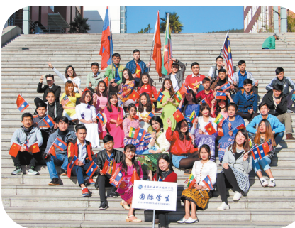
在校就读的国际留学生