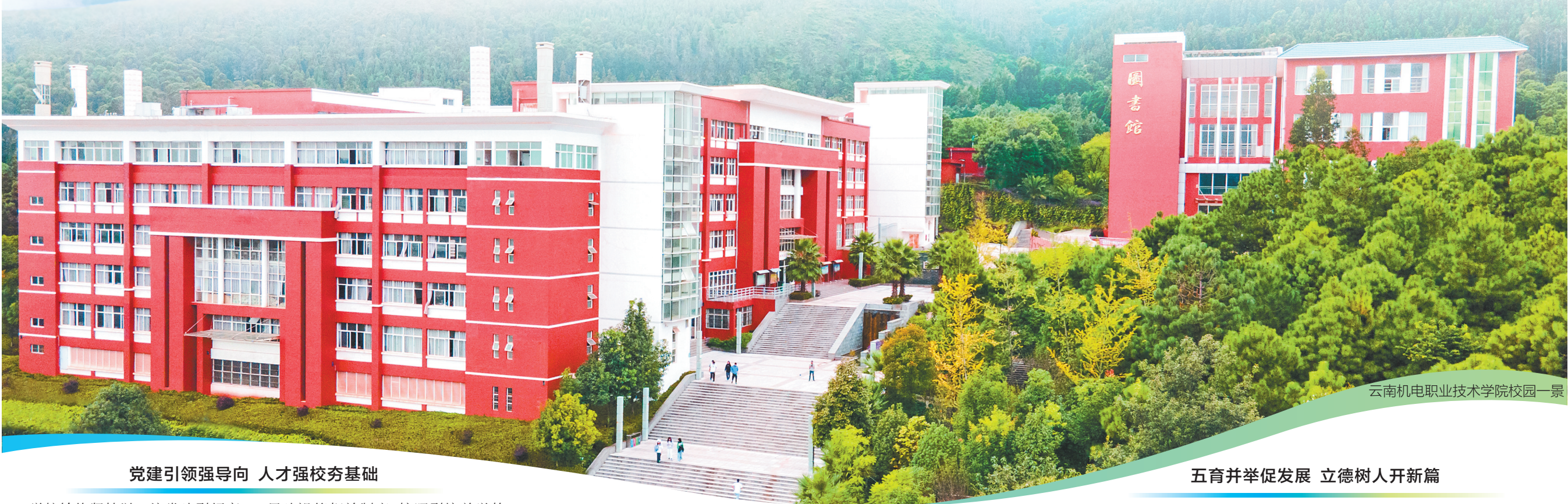
云南机电职业技术学院校园一景