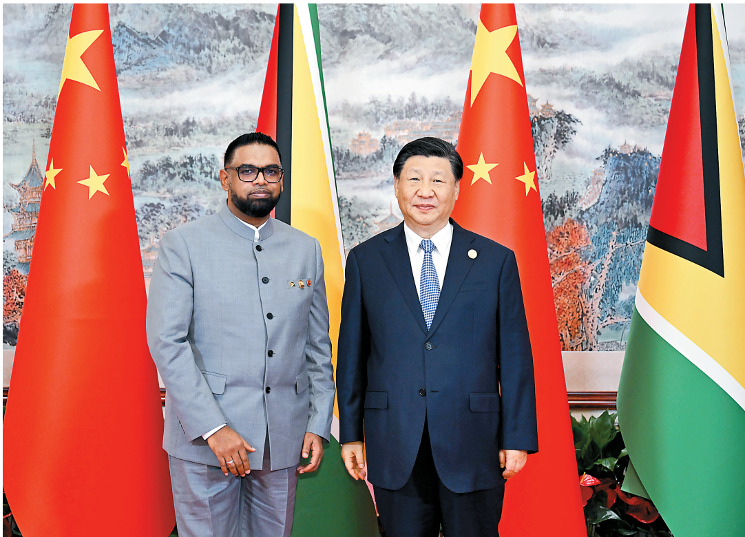
7月28日上午，国家主席习近平在成都会见来华出席第31届世界大学生夏季运动会开幕式并访华的圭亚那总统阿里。