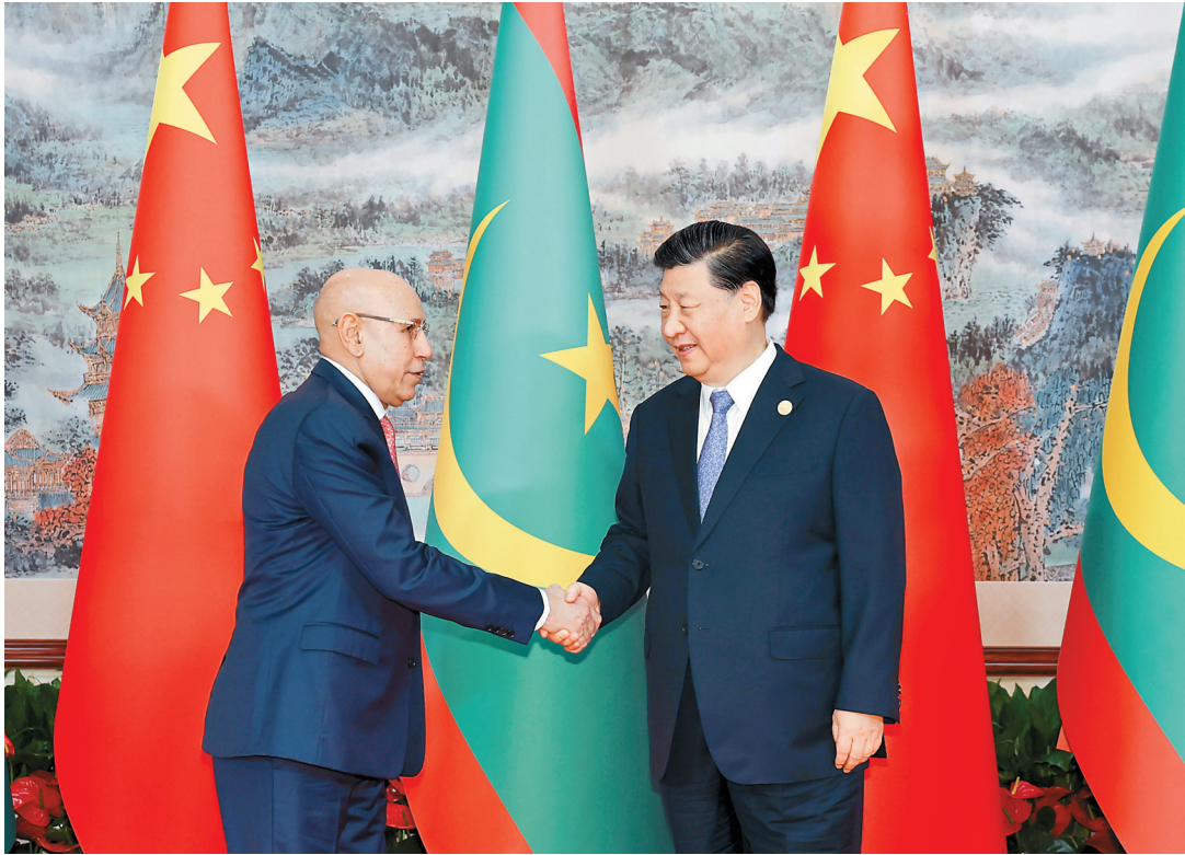
7月28日下午，国家主席习近平在成都会见来华出席第31届世界大学生夏季运动会开幕式并访华的毛里塔尼亚总统加兹瓦尼。