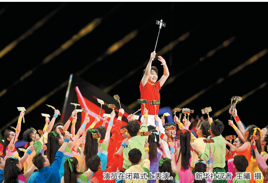
演员在闭幕式上表演。

成都大运会组委会执行主席黄强致辞，对为大运会圆满成功作出贡献的全体人员表示感谢。