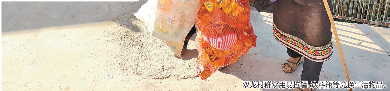
双龙村群众用易拉罐、饮料瓶等兑换生活物品。