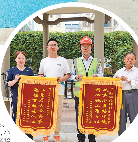
富康花园小区居民向蒙自市住建局、中交二航局赠送锦旗。

在蒙自市,像富康花园这样进行更新改造的老旧小区不在少数。从2021年起,为响应国家加强城镇老旧小区改造的号召,大力创建全国文明城市,蒙自市经过摸排调研,将建成20年以上破损严重的小区定位为提升改造项目。结合每年的改造计划,全市的城镇老旧小区改造工作分批次推进,着重围绕小区功能、环境、形象和管理服务等方面进行提升改造。改造