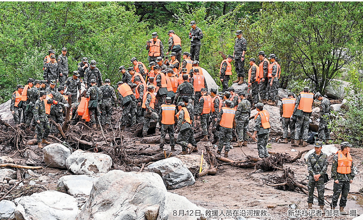
8月12日,救援人员在沿河搜救。

新华社北京8月12日电 8月11日8时至18时,陕西省西安市长安区局地出现大暴雨。18时许,长安区滦镇街道喂子坪村鸡窝子组突发山洪泥石流灾害。