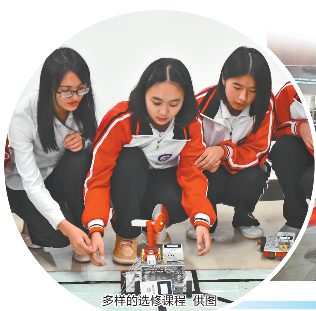
多样的选修课程 供图

2016年以来,红河州高中在校学生从6.7万人增加到10.15万人,高考一本上线率实现翻番,一本上线人数增长3.28倍,扩规提质的显著成效,标志着红河州高中教育改革迈出了坚实步伐。