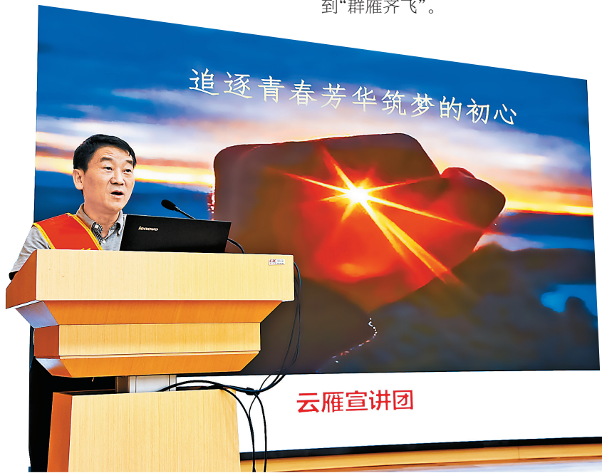
宣讲员到基层宣讲

截至目前,“云雁宣讲团”已在8个分公司开展基层巡讲26场次,3000余名员工以“现场+云视讯”的方式参加。同时,“头雁”“春雨”“星火”“青锋”“彩虹”5支宣讲队的基层理论宣讲员,以“点单式”“菜单式”“组合式”“线下+云上”等方式,开展基层巡讲活动1900场次,实现了从“云雁启航”到“群雁齐飞”。