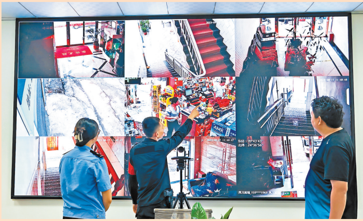
通过“乡村振兴”平台进行治安监控