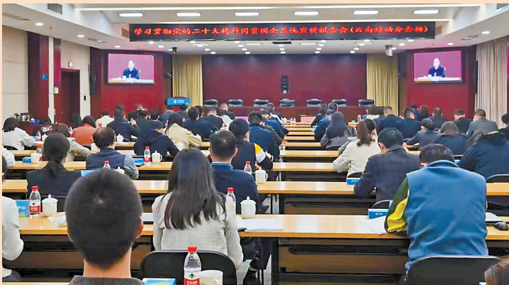
学习贯彻党的二十大精神报告会

“三个课堂”贯穿始终、覆盖全员,云南移动坚持边学习、边对照、边检视、边整改,把学习贯彻习近平新时代中国特色社会主义思想与“领题破题 合力攻坚”实践活动相结合,充分用好调查研究这一“传家宝”,不断汇聚民智、集聚民力、凝聚民心,以学习成果破难解题,推动高质量发展。