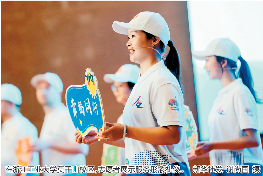
在浙江工业大学莫干山校区，志愿者展示服务形象礼仪。新华社发 谢尚国 摄