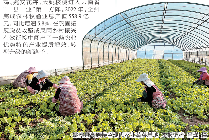
姚安县高原特色现代农业蔬菜基地 本报记者 吕瑾 摄

元谋蔬菜、南华野生菌、武定肉鸡、姚安花卉、大姚核桃进入云南省“一县一业”第一方阵。2022 年, 全州完成农林牧渔业总产值 558.9 亿元, 同比增速 5.8%, 在巩固拓展脱贫攻坚成果同乡村振兴有效衔接中闯出了一条农业优势特色产业提质增效、转型升级的新路子。