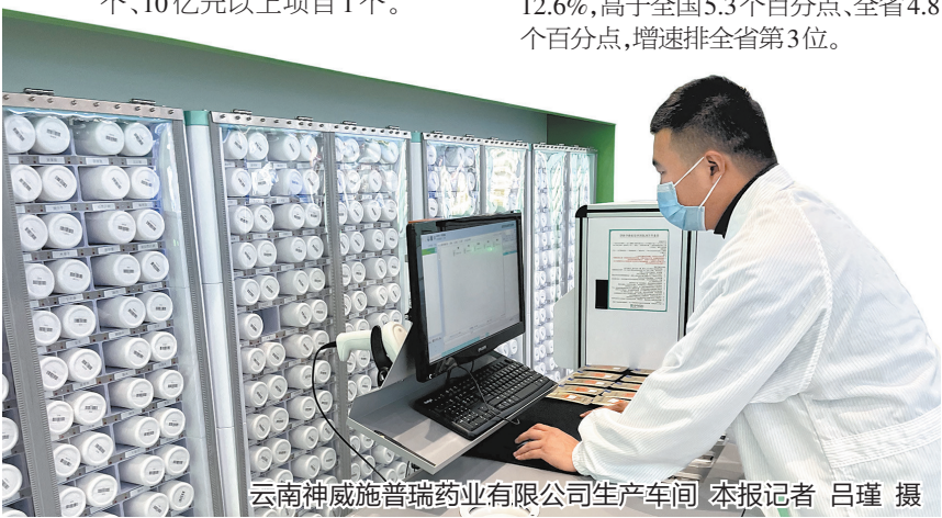
云南神威普瑞药业有限公司生产车间

楚雄州已成功帮助神威普瑞药业申报建立云南省中药配方颗粒重点实验室、工程研究中心, 实现楚雄州重点实验室零的突破。在科技创新平台的推动下, 神威普瑞药业初步完成 14 种彝药配方颗粒标准研究, 完成美洲大蠊配方颗粒的开发及产业化, 科技支撑生物医药和大健康产业作用明显。去年以来, 衡楚药业、云南药科院、华派医药等一批生物医药企业纷纷落地楚雄, 投资建设化学原料药及中间体、高端制剂产研等 5 亿元以上项目 2 个、10 亿元以上项目 1 个。