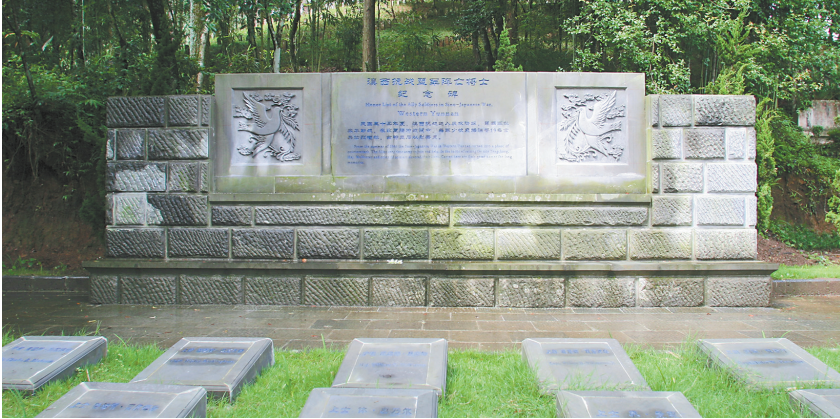
滇西抗战盟军阵亡将士纪念碑