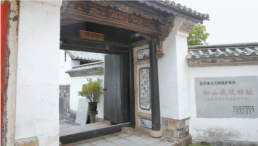
松山战役旧址

说:“德出生边地,一介书生。国家有难,心如火焚,哀我故土,难禁泪淋。今日受命,虔诚于心。随军抗战,决意牺牲。誓死报国,施教于民,支援军队,万众一心,团结各界,忠奸区分。边城重地,岂容侵吞。二十六万,民为后盾。收复家园,埋葬敌军。告慰先烈,九泉欢欣!历史重任,双肩担承。抗战到底,步步前行。特此宣誓,言出行遵。”