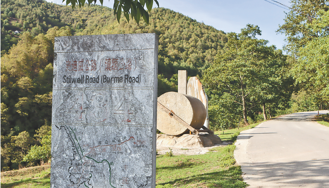
滇缅公路修筑纪念

1942年5月10日,日军进占腾冲县城,爱国民众和士绅相率逃避到腾冲北部地区,他们一致表示绝不向敌人屈服,要用各种方式进行敌后斗争。以张问德、刘楚湘为首的一大批爱国人士,组织成立了腾冲临时县务委员会代行县务。6月下旬,云南省政府正式任命张问德为腾冲县长,张问德在就职宣誓中