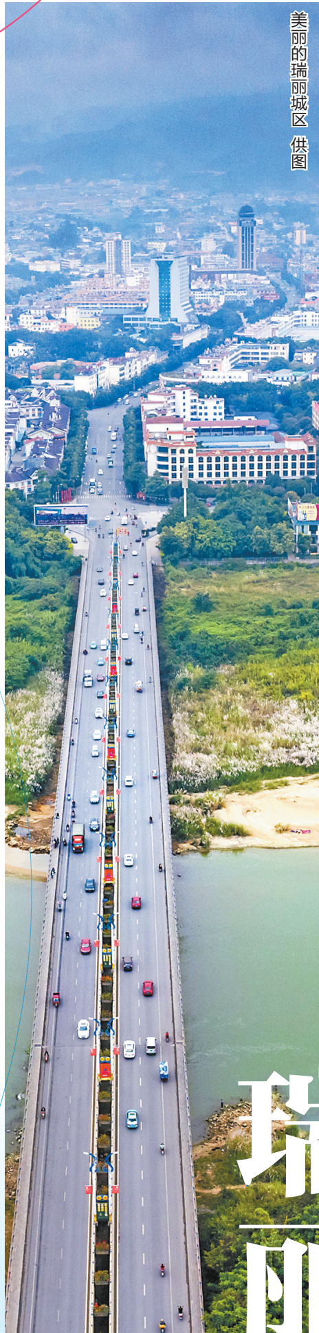
美丽的瑞丽城区

十里不同风,百里不同天。云南省拥有129个县区,每个都有特色鲜明的自然人文特征,共同承载着“有一种叫云南的生活”的丰富内涵。本期报道将聚焦地处出入境通道的河口、瑞丽、勐腊3个边境县市,挖掘当地地域特征明显的产品业态,反映沿边地区文旅发展新的尝试和探索。