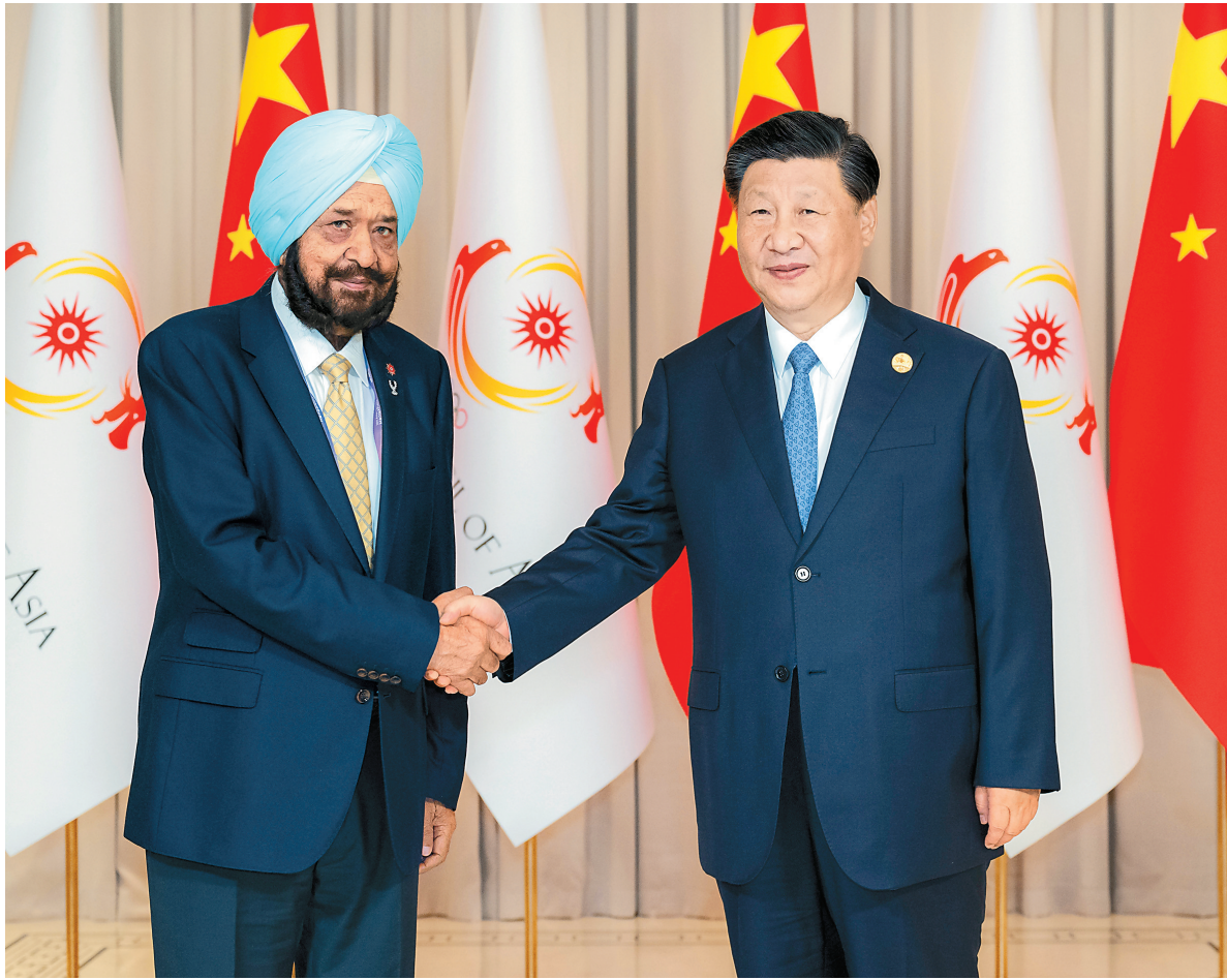
9月22日下午，国家主席习近平在杭州西湖国宾馆会见来华出席第19届亚洲运动会开幕式的亚洲奥林匹克理事会代理主席辛格。