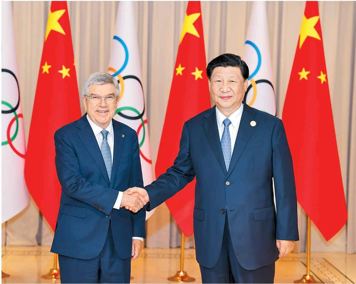
9月22日下午，国家主席习近平在杭州西湖国宾馆会见来华出席第19届亚洲运动会开幕式的国际奥林匹克委员会主席巴赫。

新华社杭州9月22日电(记者王宾 马剑) 9月22日下午，国家主席习近平在杭州西湖国宾馆会见来华出席第19届亚洲运动会开幕式的叙利亚总统巴沙尔。两国元首共同宣布建立中叙战略伙伴关系。 习近平指出，叙利亚是最早同新中国建交的阿拉伯国家之一，也是当年恢复新中国在联合国合法席位提案国之一。建交67年来，中叙关系经受住国际风云变幻考验，两国友谊历久弥坚。中叙建立战略伙伴关系，将成为两国关系史上继往开来的重要里程碑。中方愿同叙方不断充实两国关系内涵，推动中叙战略伙伴关系不断向前发展。 习近平强调，中方愿同叙方在涉及彼此核心利益和重大关切问题上继续相互坚定支持，维护两国和广大发展中国家共同利益，维护国际公平正义。中方支持叙利亚反对外来干涉，反对单边霸凌，维护国家独立、主权、领土完整，支持叙利亚开展重建，加强反恐能力建设，以“叙人主导，叙人所有”原则推动政治解决叙利亚问题，改善同其他阿拉伯国家关系，在国际和地区事务中发挥更大作用。中方愿同叙方加强共建“一带一路”合作，加大对叙利亚优质农产品进口，一道落实好全球发展倡议、全球安全倡议、全球文明倡议，为地区和世界和平与发展作出积极贡献。 巴沙尔表示，中国通过自身奋斗，走出了一条成功的中国特色社会主义道路。中国在国际事务中始终站在国际公平正义一方，站在国际法和国际人道主义一方，发挥着重要建设性作用。习近平主席提出的共建“一带一路”倡议、全球发展倡议、全球安全倡议、全球文明倡议，目的都是通过合作帮助所有人实现安全和发展，共享和平繁荣的未来，叙方高度赞赏、坚定支持，并将积极参与。叙方衷心祝贺中国取得的伟大成就，感谢中国政府给予叙利亚人民的宝贵支持，坚决反对任何干涉中国内政的行为，愿做中国长期坚定的朋友和伙伴。叙方愿以建立叙中战略伙伴关系为契机，加强双边友好合作，密切在国际和地区事务中的沟通协调。