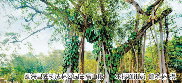
勐海县独树成林公园古高山榕

入选榜单的3株古树分别为景谷傣族彝族自治县威远镇威远街村勐卧总佛寺古高山榕、勐海县打洛镇打洛村独树成林公园古高山榕、大理市银桥镇双阳村无为寺软叶杉木;4个古树群分别是洱源县的弥苴河古树群、宾川县的朱普拉古咖啡林、兰坪白族普米族自治县的铁杉古树群、贡山独龙族怒族自治县的秃杉古树群。