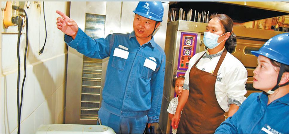
南方电网云南楚雄大姚供电局工作人员到城区月饼加工坊开展安全用电检查。