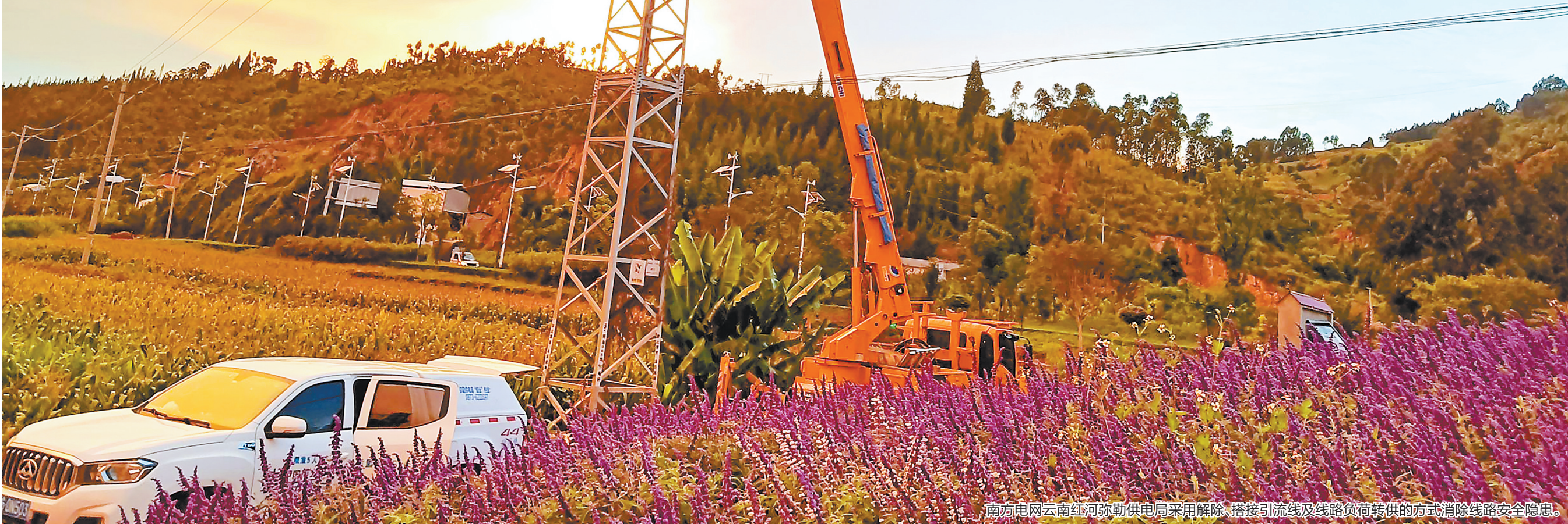
南方电网云南红河弥勒供电局采用解除、搭接引流线及线路负荷转供的方式消除线路安全隐患。