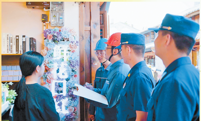
南方电网云南大理下关供电局与古城消防支队联合排查安全隐患。