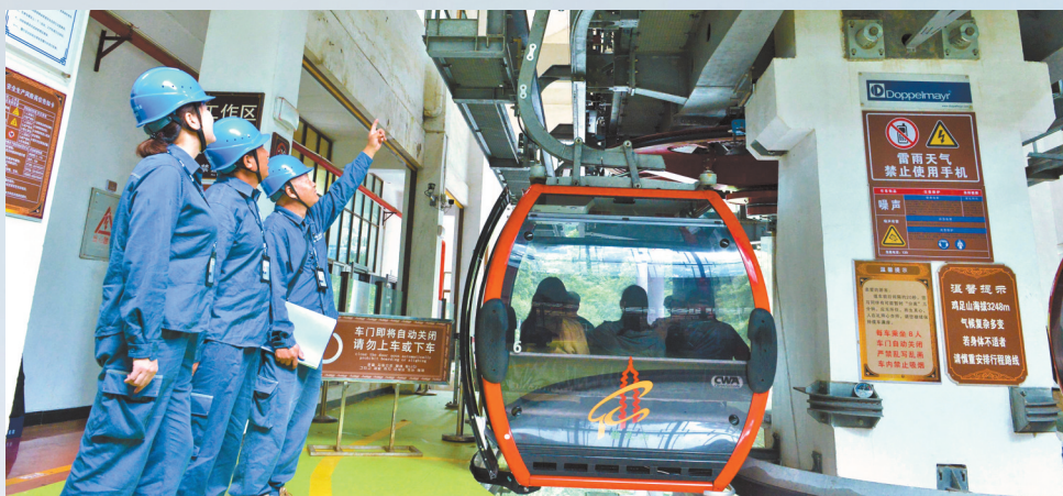
南方电网云南大理宾川供电局鸡足山供电所工作人员在鸡足山景区开展用电检查。