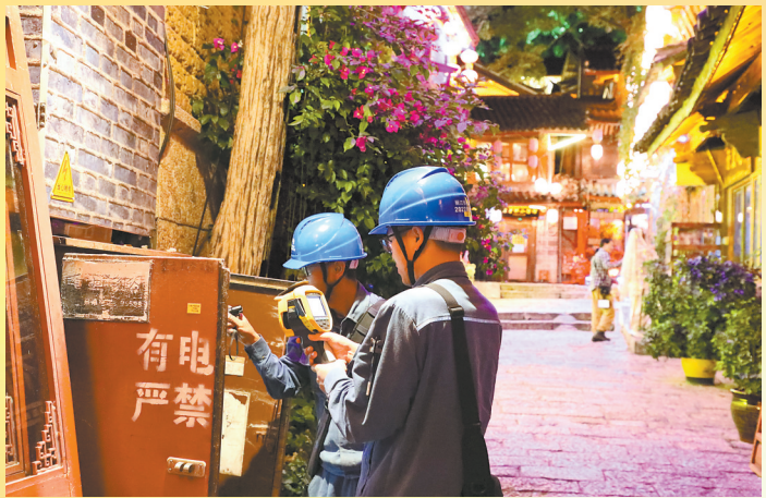
南方电网云南丽江供电局进行负荷检测和隐患排查。