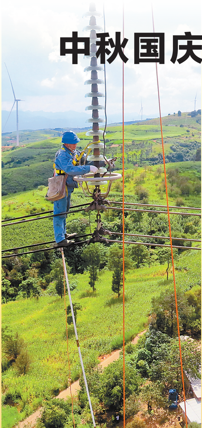
南方电网云南送变电工程有限公司红运巡检站工作人员对500千伏红宁甲线全线开展检修、消缺。