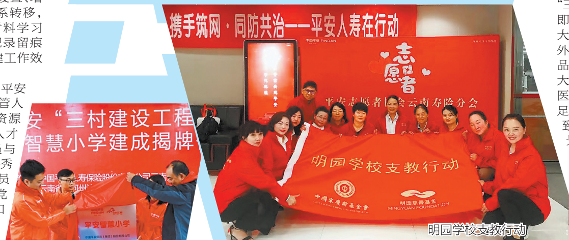
明园学校支教行动