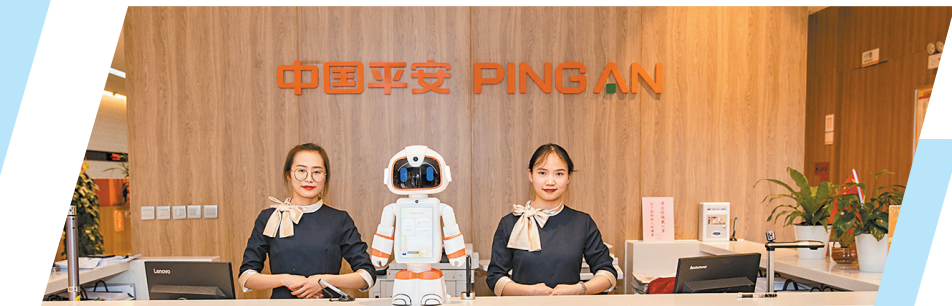
平安客服智享门店

——理赔简单便捷有温度。平安人寿率先推出了闪赔、重疾先赔、特案预赔、智能预赔、医疗险赔付5000元以下免收理赔材料等特色理赔服务。平安人寿云南分公司入滇30年以来，一直秉承以客户需求为先导、以诚信理赔为依约，不断践行保险责任，理赔54万件，赔付金额40.7亿元，用实际行动守护千家万户的幸福平安。其中，赔付金额最高的案件为540万元，赔付最快的案件仅耗时1.9分钟；2015年首创业内重疾先赔，赔付金额超1.7亿元。