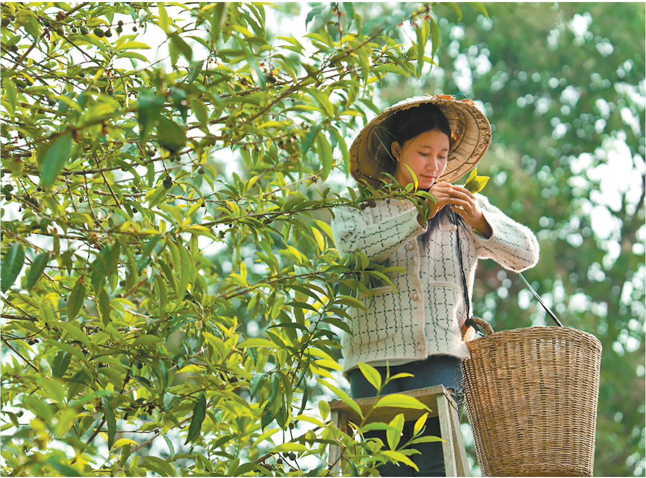
老挝村民在36庄园采摘茶叶

近日,普洱景迈山古茶林文化景观申遗成功,引起了国外朋友圈对茶叶、茶产业、茶人的探讨与关注。云南省南亚东南亚区域国际传播中心记者采访了尼泊尔、斯里兰卡、马来西亚、老挝等南亚东南亚国家的相关人士,探讨各国茶文化的异同,以及人与自然和谐共生的共同价值理念。