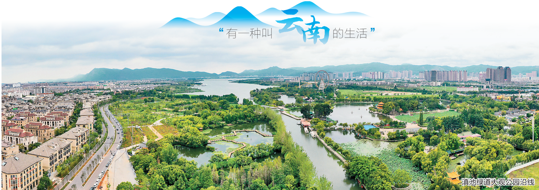
滇池绿道环草海段全部开放