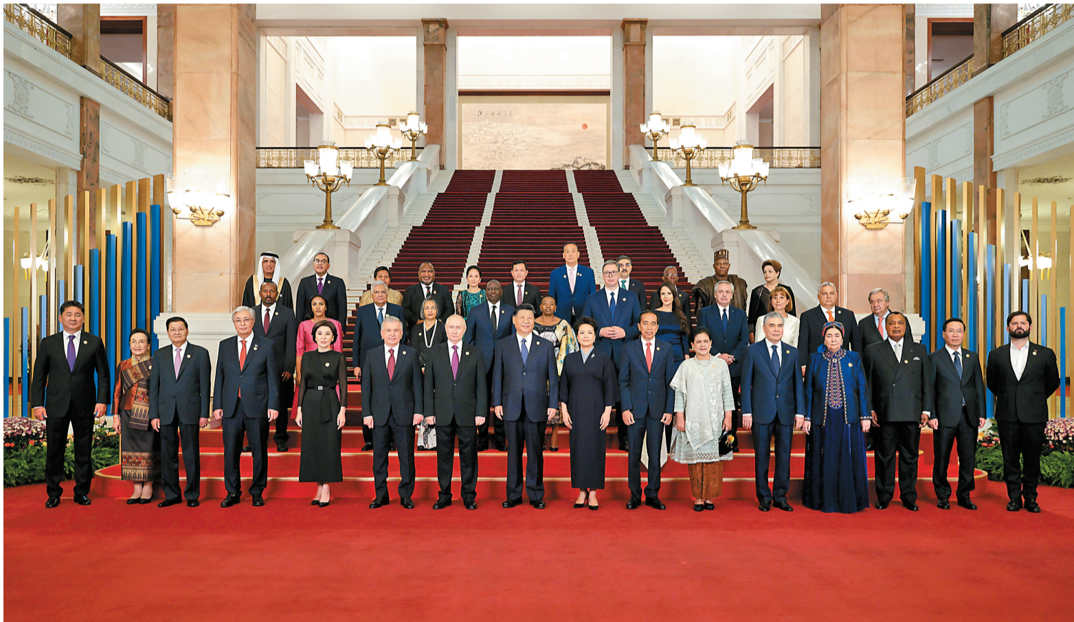
10月17日晚，国家主席习近平和夫人彭丽媛在北京人民大会堂举行宴会，欢迎来华出席第三届“一带一路”国际合作高峰论坛的国际贵宾。这是习近平和彭丽媛同国际贵宾合影留念。