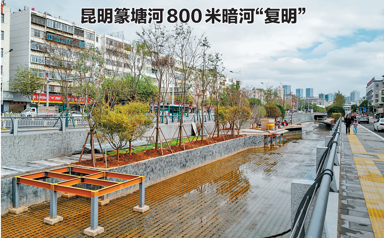
昆明篆塘河 800 米暗河“复明”

云南省创新创业大赛自2015年举办以来已成功举办9届,成为我省影响力最大、覆盖面最广、办赛规格最高的双创品牌赛事。