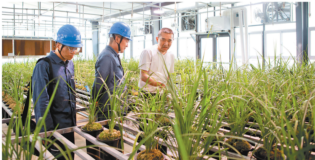
检查花卉大棚用电设施

为确保冬季来临前兰花种植户用电稳定,近日,南方电网云南大理鹤庆供电局组织工作人员主动对鹤庆花卉市场用电设备进行系统检查,确保花卉市场环境设备可靠用电,当好“护花使者”,确保兰花销售旺季农户用电需求。