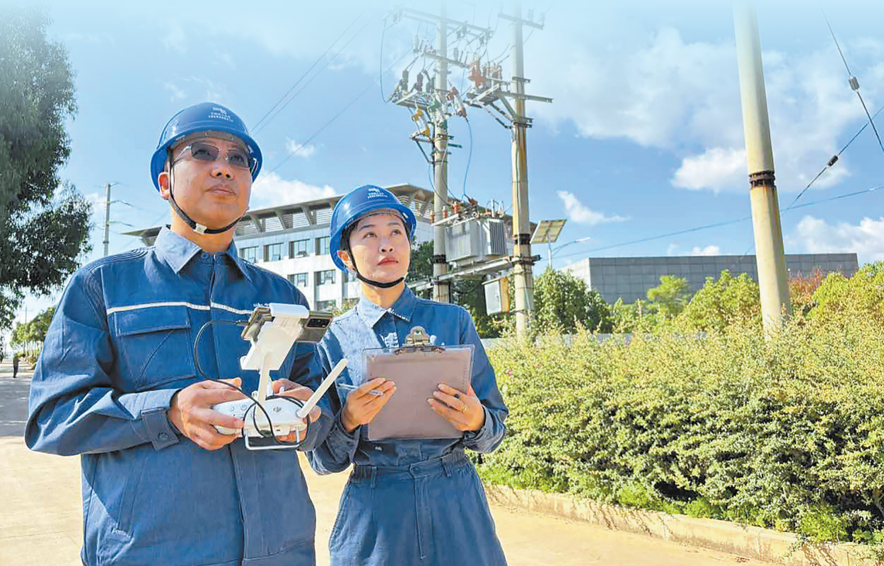
工作人员操控无人机