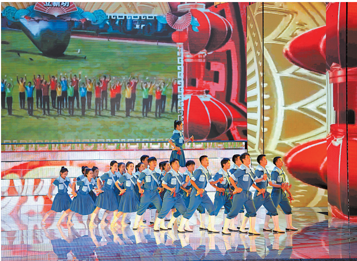
奋斗有我 情景朗诵描绘着50年间,一代又一代的“玉溪”耕耘者走出的一条踔厉奋发、坚定信念、启迪智慧的奋斗之路,令人振奋,时尚的情景时装秀将“玉溪”品牌元素巧妙融入设计,展示了一张张多姿多彩的“红塔名片”。