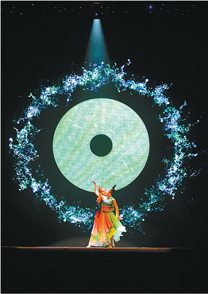
和美共享 优美的舞姿时而宛若一幅壮美和谐的生态景象,碧波万顷的抚仙湖边,万亩烟田绿意盎然,时而变幻成山上那静静伫立的红塔,夕阳余晖给它镀上了金黄的颜色;时而如同青翠空灵的翡翠,如切如磋,如琢如磨;时而又演绎着“和为贵、谐为美”的动人画卷。