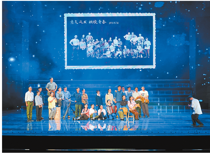
往日时光 从艰苦创业的时期中走出的开拓者们,踏着坚实的脚步走上舞台,在大雨中争分夺秒搬运烟机、在忙碌中迎来新生命的诞生,一个又一个伴随着付出与收获、成长与感动的故事以情景剧的形式回溯着。