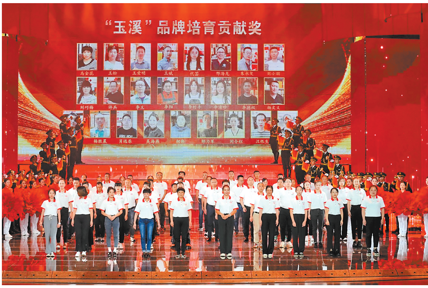
一路同行 “玉溪”紧跟消费需求,不断自我进化的品牌进阶,离不开与终端零售户的一路同行。作为一线的战友,当晚,他们荣获“玉溪”品牌培育贡献奖,与“玉溪”共同期待更美好的明天。