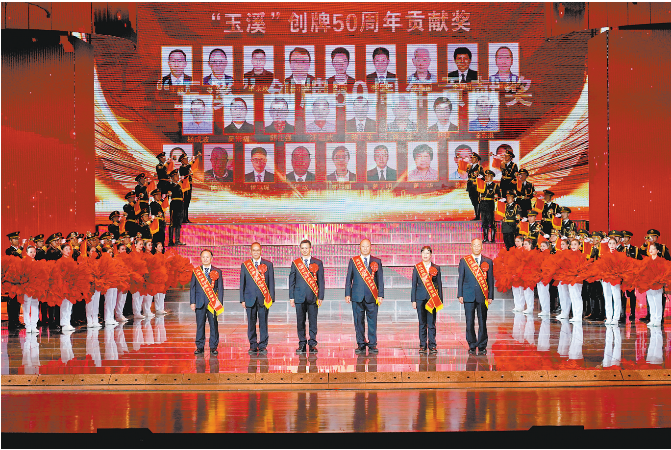
共生共长 向奋斗者致敬,是为了坚定信念、凝聚力量。在“玉溪”创立50周年表彰会环节,红塔集团创业者、劳模、先进代表荣获“玉溪”创立50周年贡献奖,他们与“玉溪”共生共长,“玉溪”也回以最崇高的敬意。